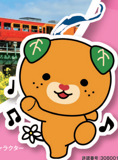
愛媛県イメージアップキャラクター みぎゃん