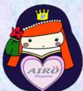
愛媛労災病院 マスコットキャラクター AIRO（あいろ）ちゃん