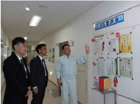
生産管理室視察(5 S委員会掲示板)