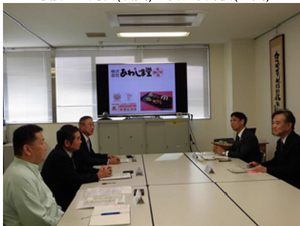
懇談する局長(右奥)と代表取締役(左奥)