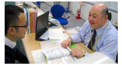
業界に精通した専任がマン・ツー・マンでサポート!