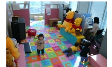
全オフィスに保育士を常駐安心してお仕事探しに専念