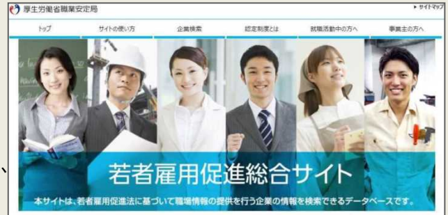
「若者雇用促進総合サイト」

個別企業ごとに企業概要、雇用管理の状況、求職者に向けたメッセージなどを掲載することで、積極的な企業情報の発信と若者とのマッチングを促進していきます。