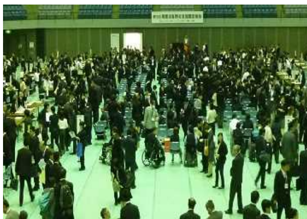
(写真：昨年10月23日開催の「障害者雇用促進就職面接会」於：千葉ポートアリーナ)