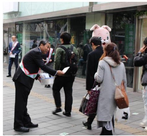
「千葉労働局長を筆頭に各関係団体代表が配布を行いました」