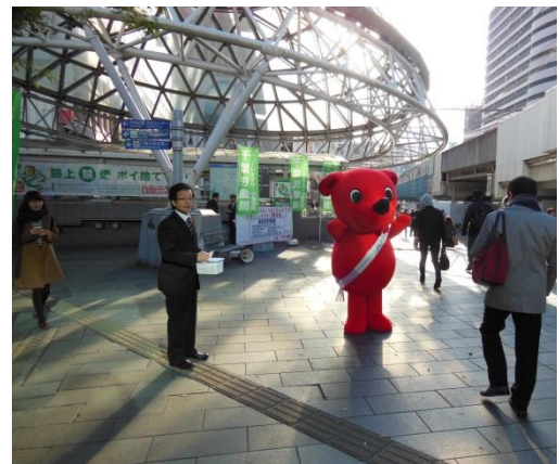
「たくさんの方に加入促進リーフレット等を受け取っていただきました」