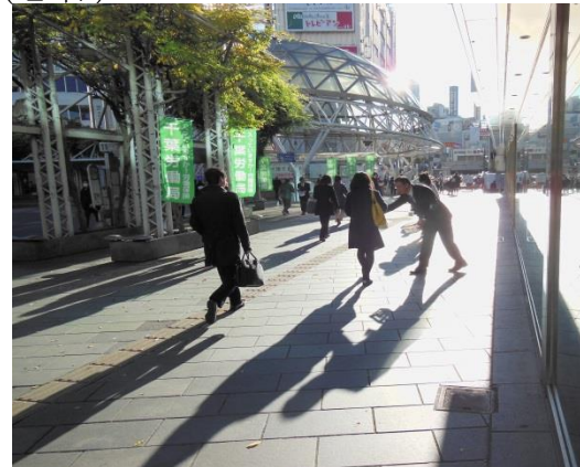
「4日間、ご協力ありがとうございました」