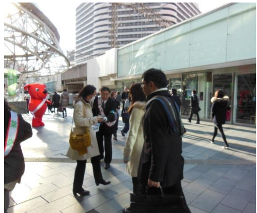
「チーバくんも応援に来てくれました」