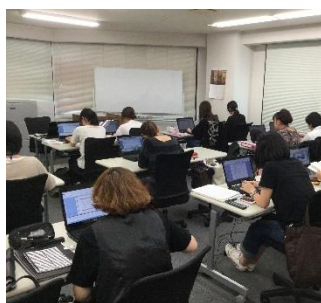
清潔で広々とした訓練教室