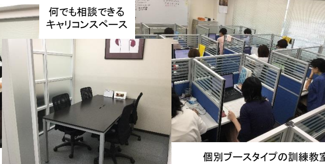
個別ブースタイプの訓練教室