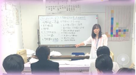
生活支援技術(基礎・入浴介助)