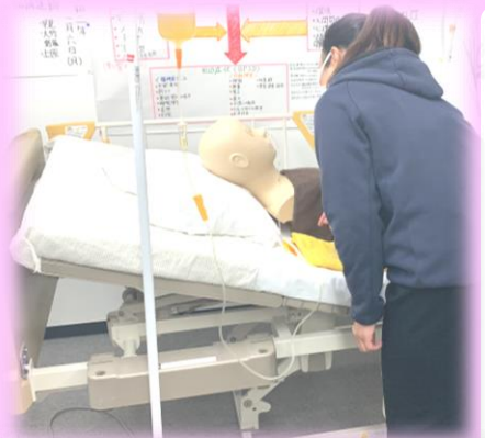
医療的ケア演習(胃ろう実習)