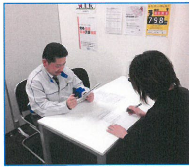
面接担当による、詳細な条件説明!