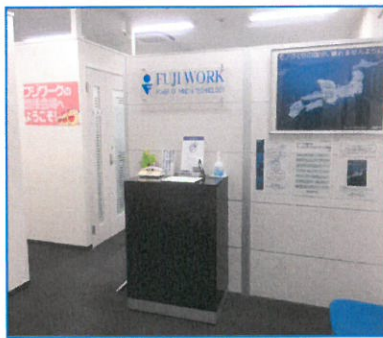
面接会場(千葉事業所)