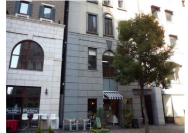
オフィスは汐留のイタリア街にあります