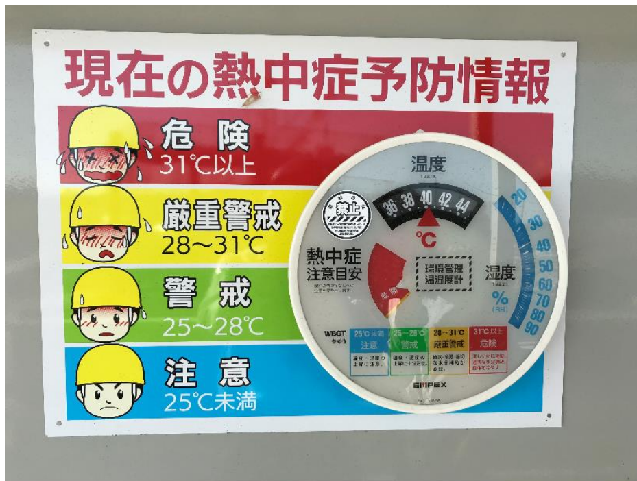
標示看板設置状況