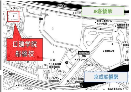
↑最寄駅から選考会場までの地図