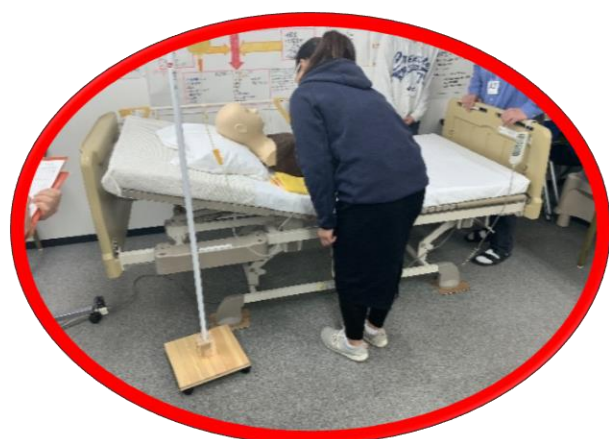
医療的ケア演習 (経管栄養演習)