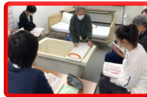
生活支援技術 (入浴)