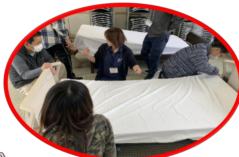
生活支援技術 (基本)