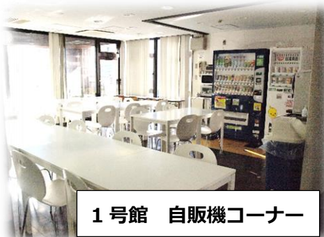
1号館 自販機コーナー