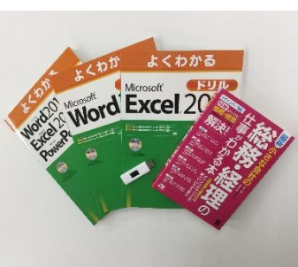
ビジネス事務スキルを習得できる