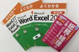
ビジネス事務スキルを習得できる