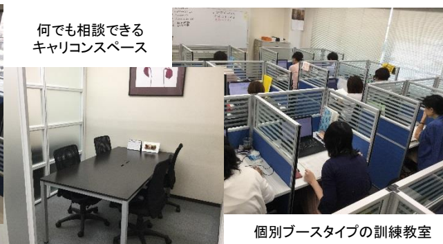
個別ブースタイプの訓練教室