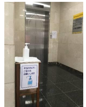
エレベーターエントランスの消毒液 教室入り口の消毒液及び空間除菌