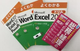
ビジネス事務スキルを習得できる