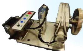
揺動空気圧モータ