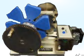
ダブルピンゼネバ