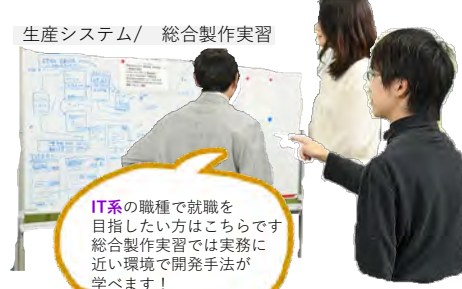
生産システム/総合製作実習

IT系の職種で就職を目指したい方はこちらです。総合製作実習では実務に近い環境で開発手法が学べます！