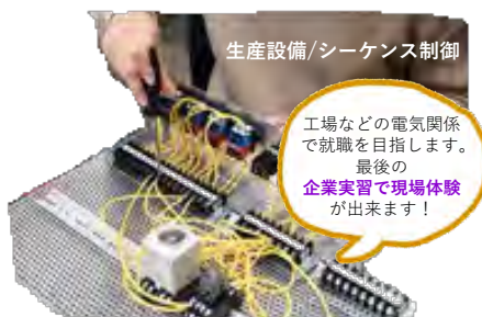
生産設備/シーケンス制御