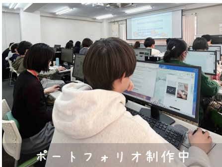
ポートフォリオ制作中

本訓練は、Webデザイン関係の資格取得を目指せる訓練コースです。模擬面接や、就職活動・面接時の心得などの講義を組み入れています。