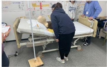
医療的ケア演習（経管栄養演習）