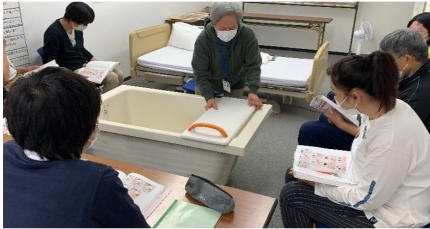
生活支援技術（入浴）