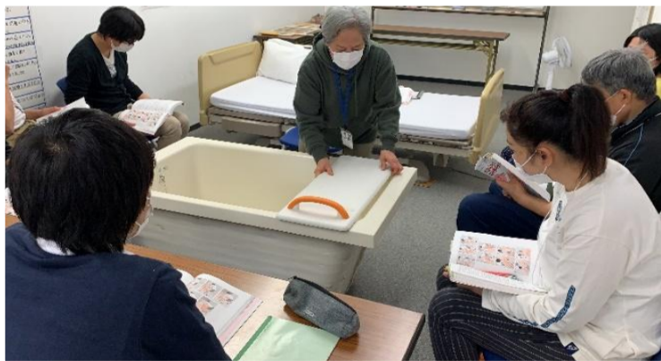
生活支援技術（入浴）