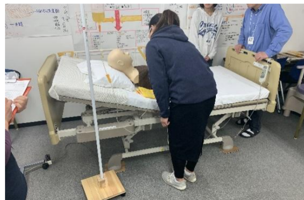
医療的ケア演習（経管栄養演習）