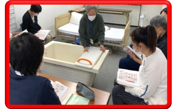
生活支援技術 (入浴)