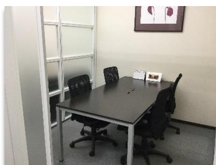
何でも相談できるキャリアコンスペース