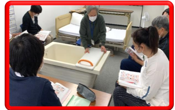
生活支援技術 (入浴)