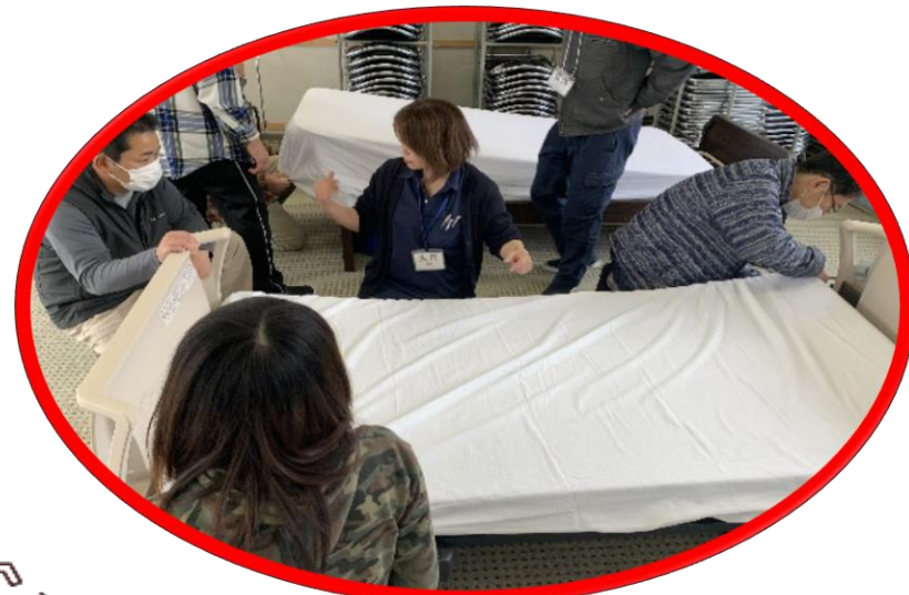
生活支援技術 (基本)