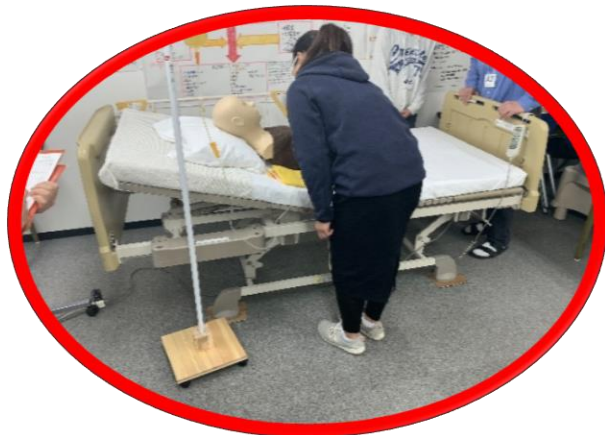
医療的ケア演習 (経管栄養演習)