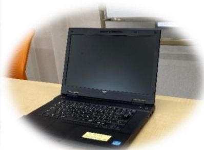
ノートパソコン を貸与します