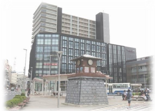
なごみの米屋スカイタウンホール