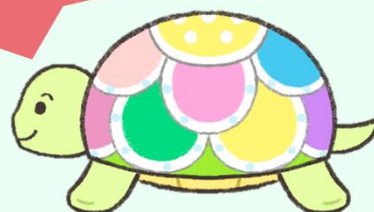
介護離職者応援サポーター キャラゴ