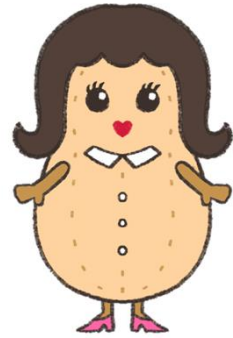
マザーズハローワークちば広報部長 ☆びーなっつママ☆