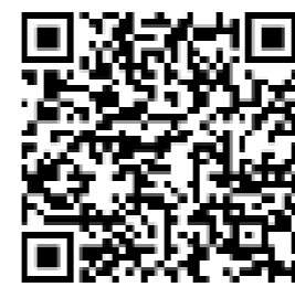
【厚労省ホームページのQRコード】