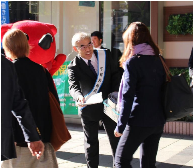
<街頭キャンペーンの様子>

その取り組みの一つとして、令和元年11月6日8時30分からJR千葉駅東口において「ちばの魅力ある職場づくり公労使会議」による働き方改革街頭キャンペーンと併せて実施しました。