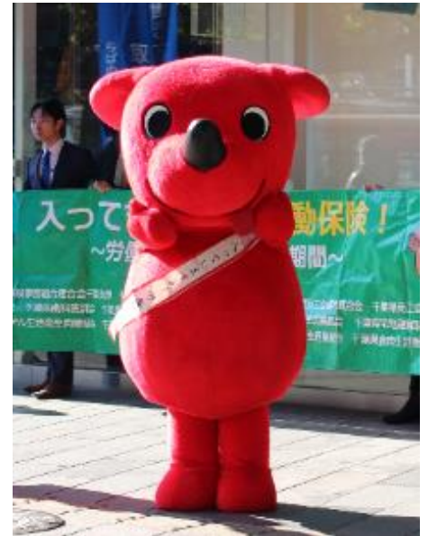
<チーバくんも駆けつけてくれました>