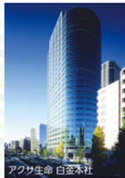
アクサ生命 白金本社