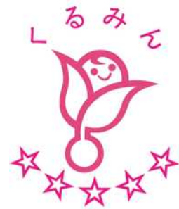
次世代認定マーク