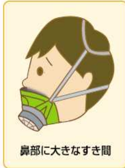
鼻部に大きなすき間