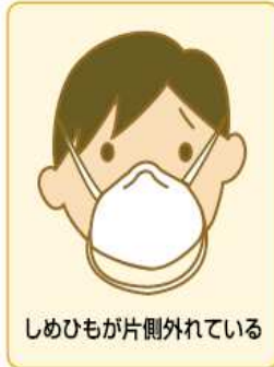
しめひもが片側外れている