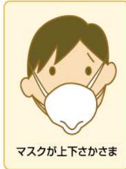
マスクが上下さかさま