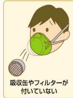
吸気弁やフィルターが付いていない