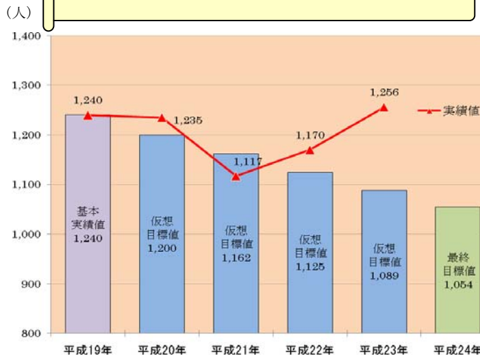
第11次労働災害防止計画の目標と実績