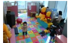
全オフィスに保育士を常駐安心してお仕事探しに専念