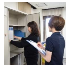
書類整備のお仕事