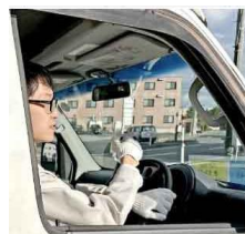
配達運搬のお仕事