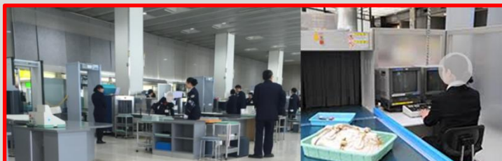
職場は、こんなイメージです。（本物ではありません）