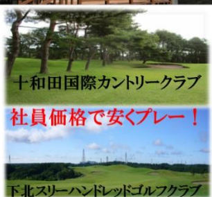
十和田国際カントリークラブ 社員価格で安くプレー！