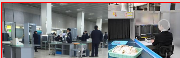
職場は、こんなイメージです。（本物ではありません）