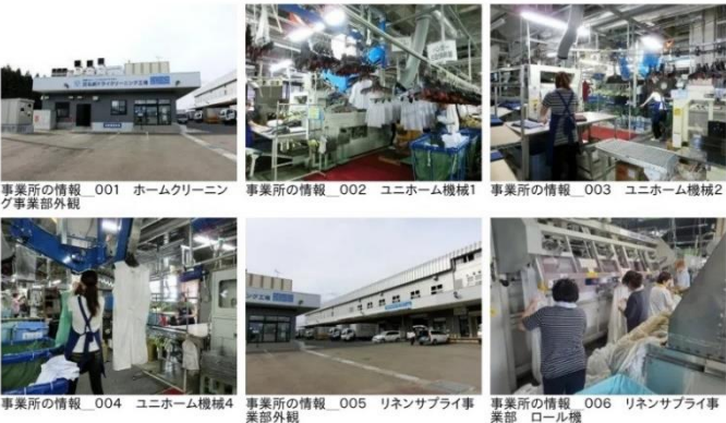
画像掲載につきましては、事業所様より許可を得て掲載しております。