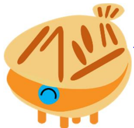
★ハローワーク野辺地 公式キャラクター 『ハローホッター』

青森労働局では10月から12月を「介護就職支援強化期間」と定め、県内の各ハローワークの実情に応じた求人者支援の取組を展開します。