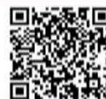
ワークキャリア公式LINE

キャリアコンサルタントによる個人面談(オンライン)の他、希望者には履歴書の添削や面接指導なども個別に行っております。また、ジョブ・カード(職業能力証明シート)の作成支援も実施しております。