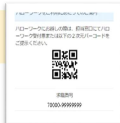
2次元バーコード イメージ図

5. ID (登録したメールアドレス)・パスワードを入力し ハローワーク受付表 または 2次元バーコード をハローワーク総合 受付に提示する