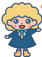
パートタイム・有期雇用労働法 キャラクター「パゆうちゃん」

相談・個別訪問支援・出張相談会支援・セミナー開催支援はすべて 無料 でご利用いただけます。お気軽にご利用ください。