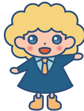
パートタイム・有期雇用労働法 キャラクター「パゆうちゃん」

電話相談を平日9時から17時まで受付していますが、受付時間外または相談予約については下記相談申込書によりFAXにてご送付ください。こちらからお電話をさせていただきます。