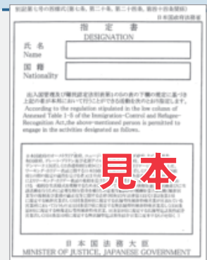
旅券に添付された指定書▶

在留資格が「特定技能1号」、「特定技能2号」の場合には分野を、 在留資格が「特定活動」の場合には活動類型を、 旅券に添付されている指定書(右参照)でそれぞれ確認し、 下表のうちいずれかを、在留資格欄に記入してください。