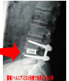
腰痛(ヘルニア)となり治療で金具を入れた例