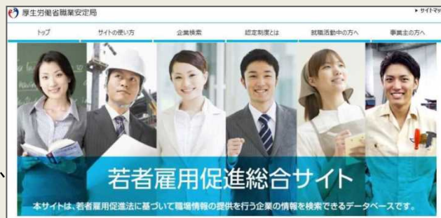
「若者雇用促進総合サイト」

個別企業ごとに企業概要、雇用管理の状況、求職者に向けたメッセージなどを掲載することで、積極的な企業情報の発信と若者とのマッチングを促進していきます。