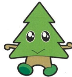
秋田県マスコット スギッチ